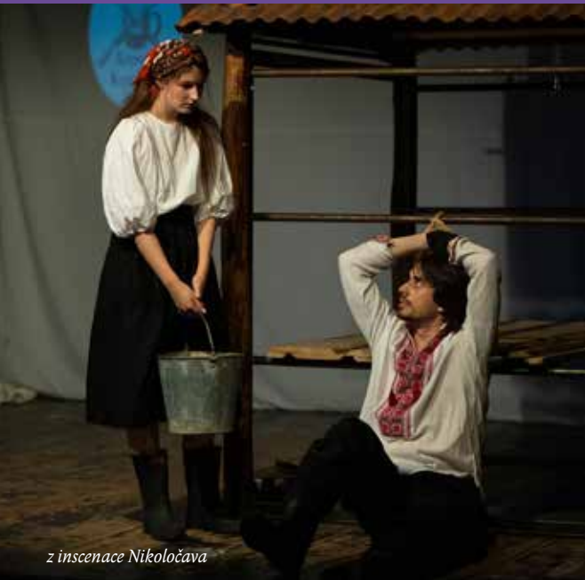
z inscenace Nikoločava